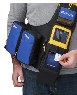
Custodia per trasporto